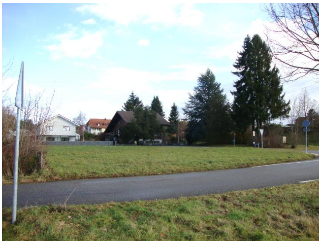
Aussicht nach Osten