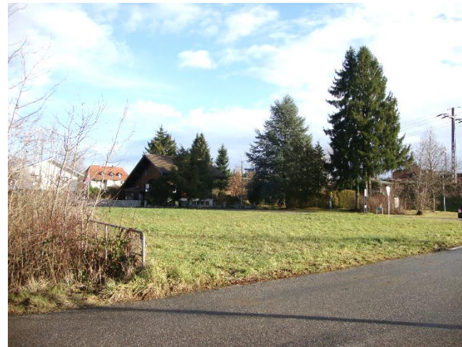
Aussicht nach Osten