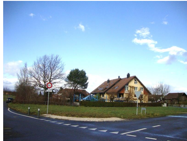
Aussicht nach Norden