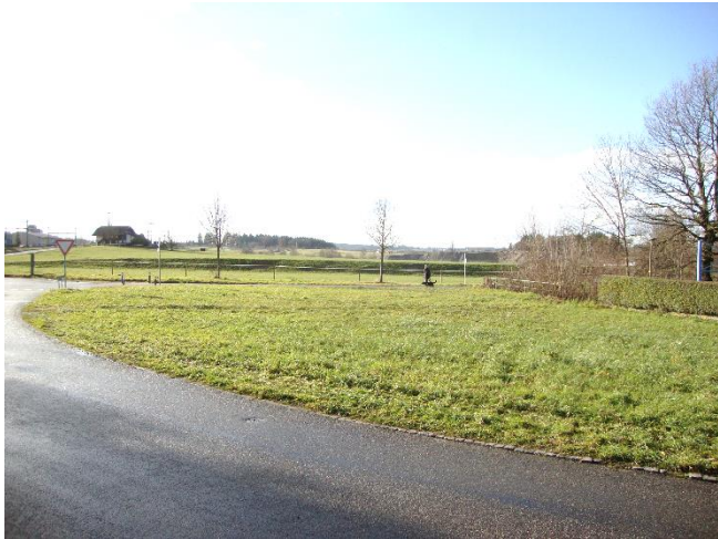
Aussicht nach Westen